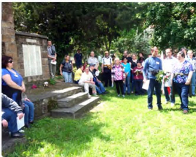
A sérültek elhelyezték a megemlékezés virágait a Falukertben levő emlékműveknél.

A HITÉS FÉNY „VIDÁMSZÍVEK” KÖZÖSSÉGE, JOBBÁGYI