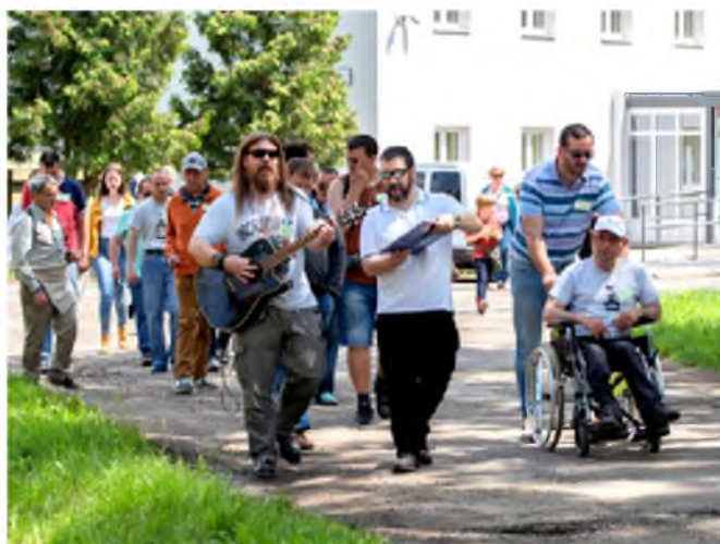
Énekszóval halad a zarándoklat a jobbágyiművelődési ház előtt.