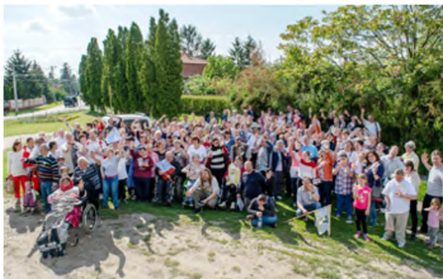
A hazaindulás előtt még egy búcsúfotó. A képen látható sokmosolyt fogjuk megőrizni a szívünkben és a lelkünkben. Köszönjük, hogy eljöttetek hozzánk!