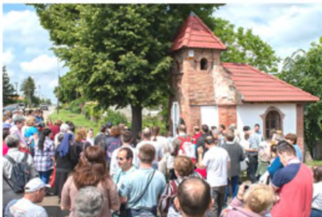
Az első állomás a Mária-kápolna volt.