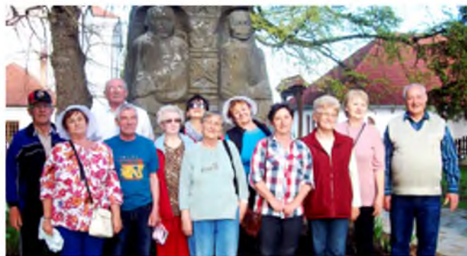
Tamási Áron sírjánál.