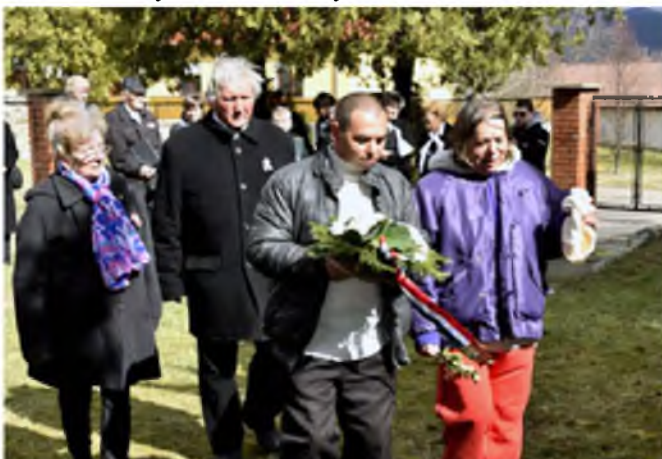
A Hit és Fény Vidám Szívek Jobbágyi Közössége koszorúz.