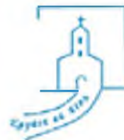
Emléklap – A bejárt útvonal képeit minden vendég és közreműködő megkapta.