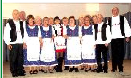
Oklánd, nemzetközi kórustalálkozó, a Jobbágyi Daloskör.