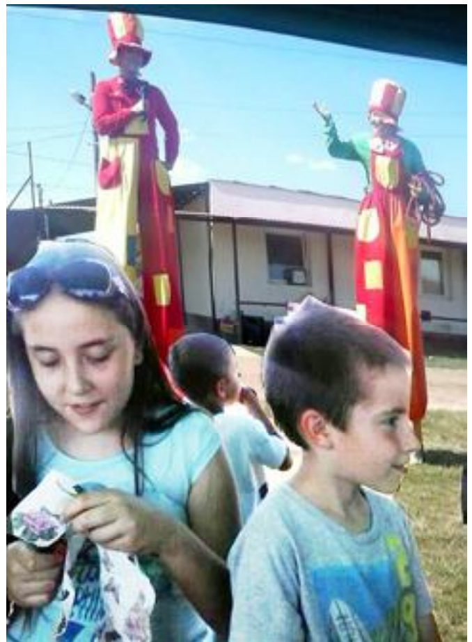
A hűsítő árnyékban kézműves foglalkozás, a tűző napon a Kedvcsináló gólyalábasok műsora zajlott.

Ezúton is köszönjük a résztvevők és segítők lelkes és kitartó munkáját!