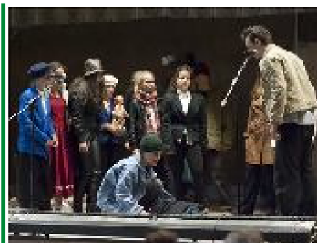
Valahol Európában a kisbágyoni színjátszók előadásában.