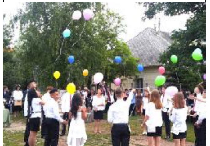
Elköszöntek a végzős tanulóka jobbágyi iskolától.