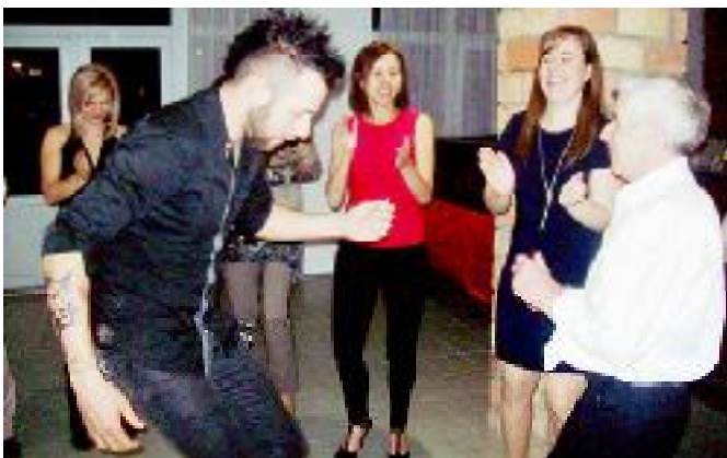
Sok fiatal is részt vett a jótekonysági bálón.