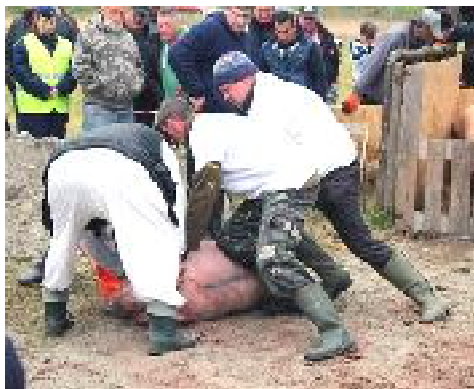
Munkában a jobbágyi böllércsapat Héhalomban.