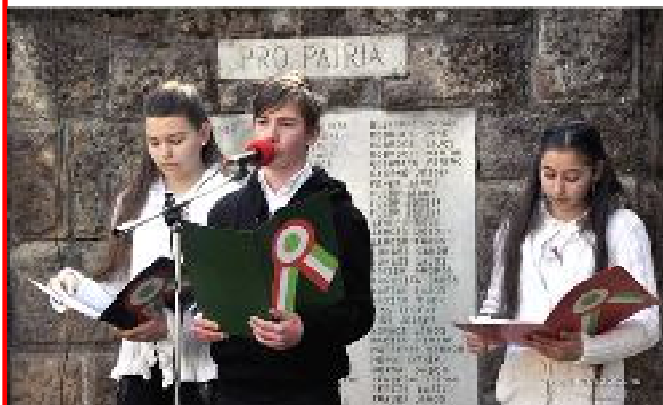
A Fáy András Általános Iskola tanulói ünnepi műsorral emlékeztek.