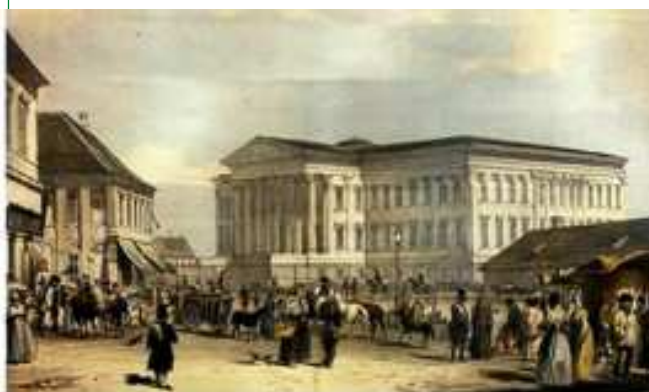
1848 - Nemzeti Múzeum