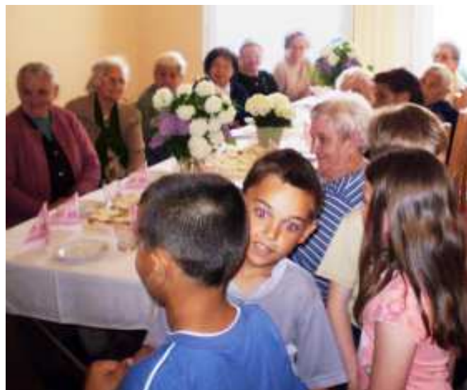
Az anyák napi ünnepségen a 2. osztályos tanulók versekkel, énekekkel, tánccal köszöntötték a klub időseit.