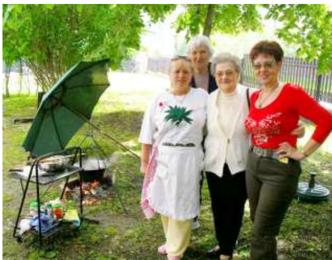
A rizseshús készítői figyelmüket a fotózásra fordították...

A borongós idő ellenére a derű, s a jókedv volt az úr, az eső csak délután kerekedett felül.