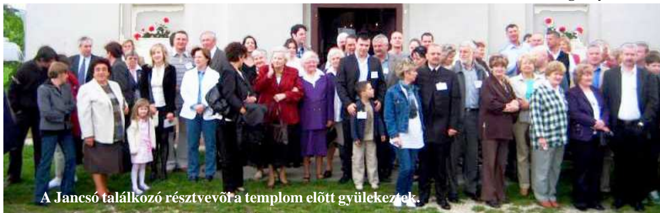
A Jancsó találkozó résztvevői a templom előtt gyülekeztek.