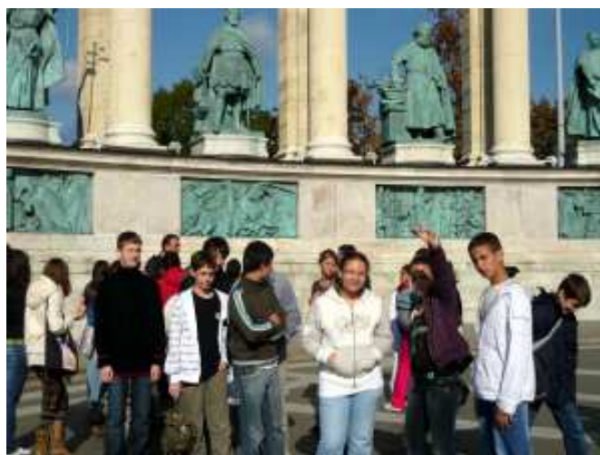
A tanulmányi kirándulás egyik helyszínén.