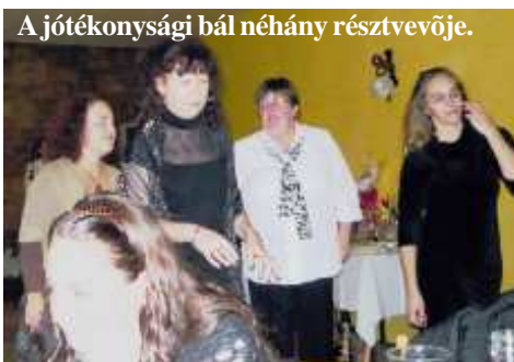
A jótékonyági bál néhány résztvevője.